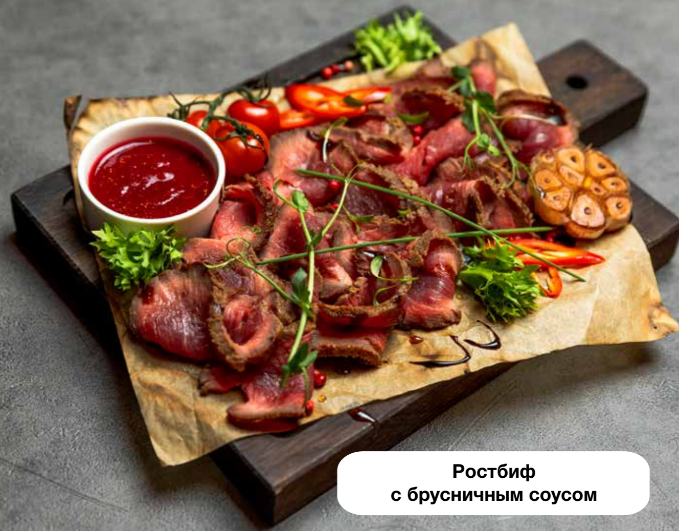
Ростбиф с брусничным соусом