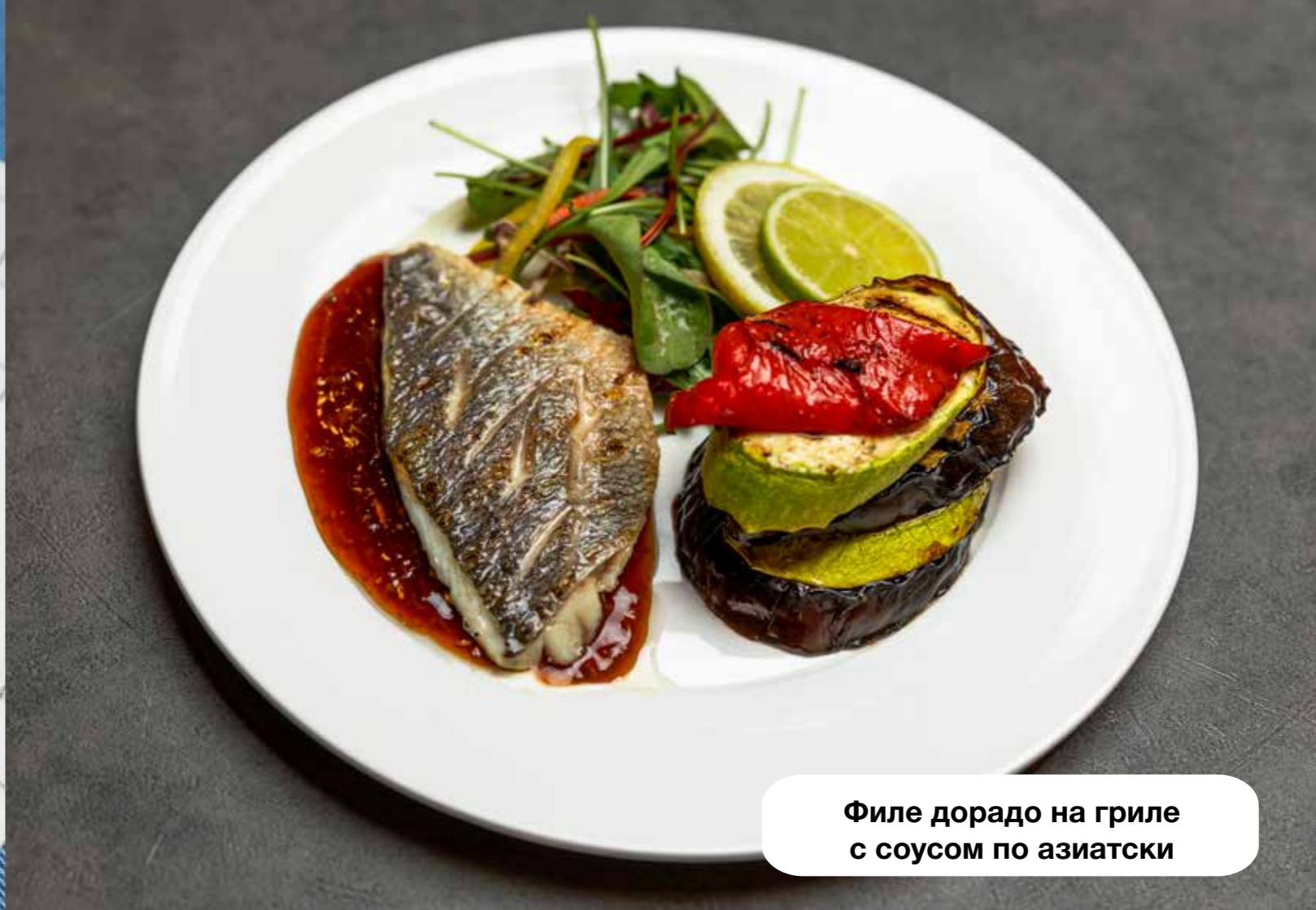
Филе дорадо на гриле с соусом по азиатски