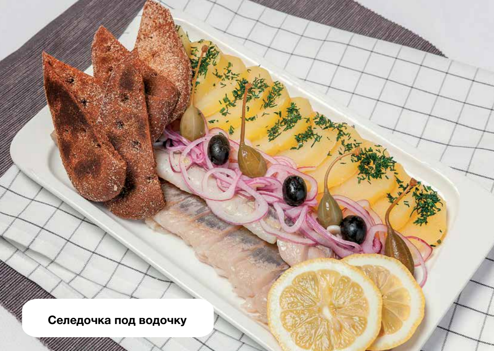
Селедочка под водочку