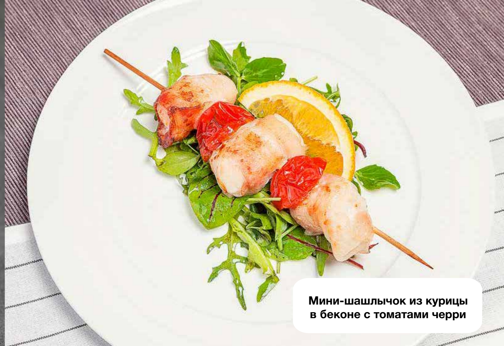
Мини-шашлычок из курицы в беконе с томатами черри