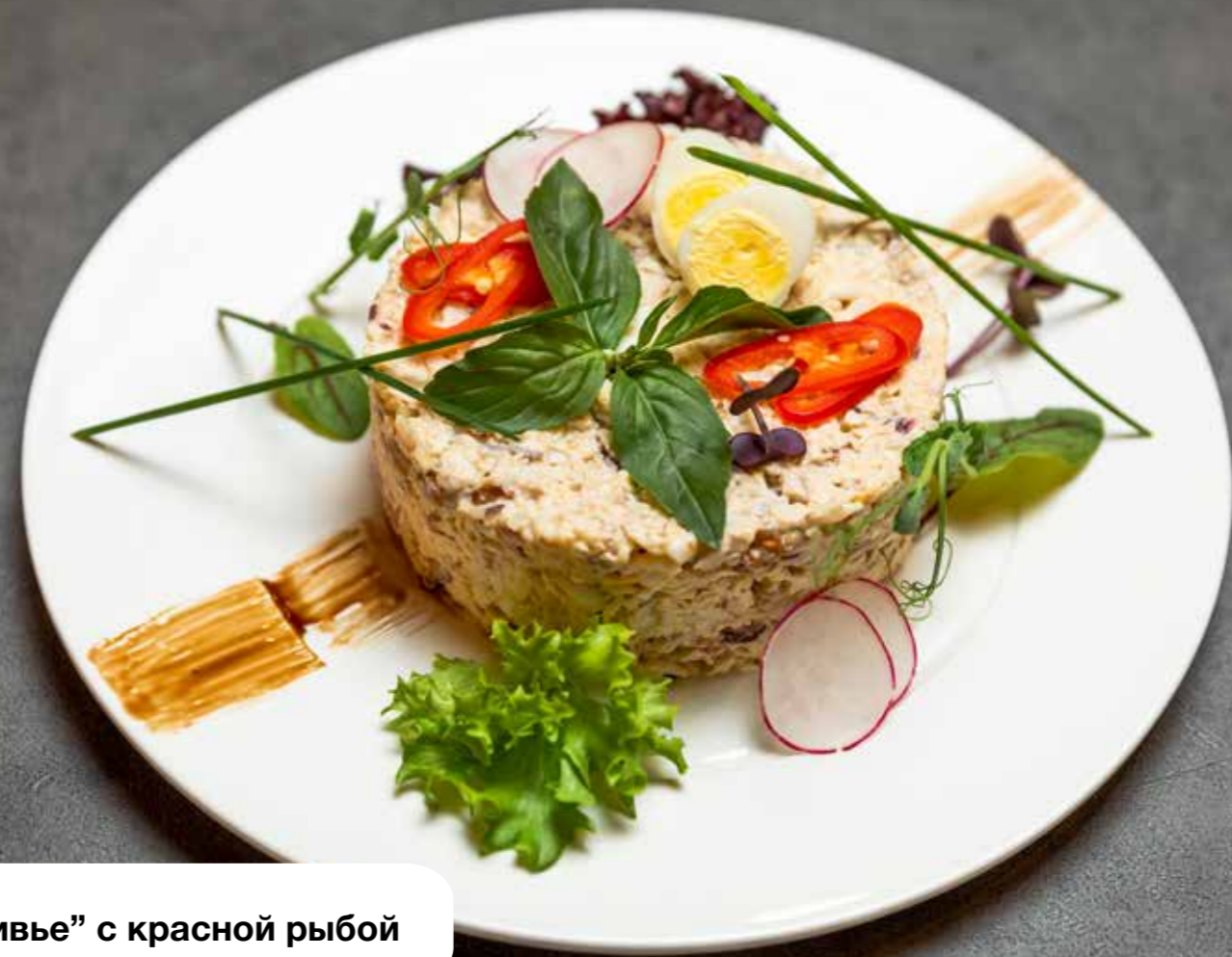
“Оливье” с красной рыбой