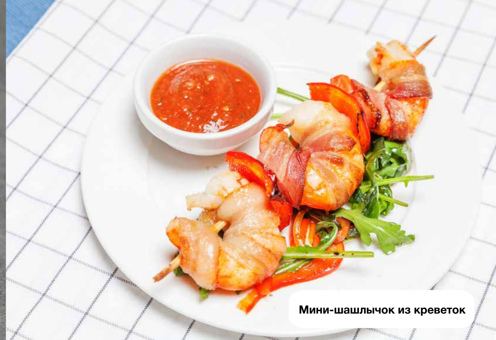
Мини-шашлычок из креветок