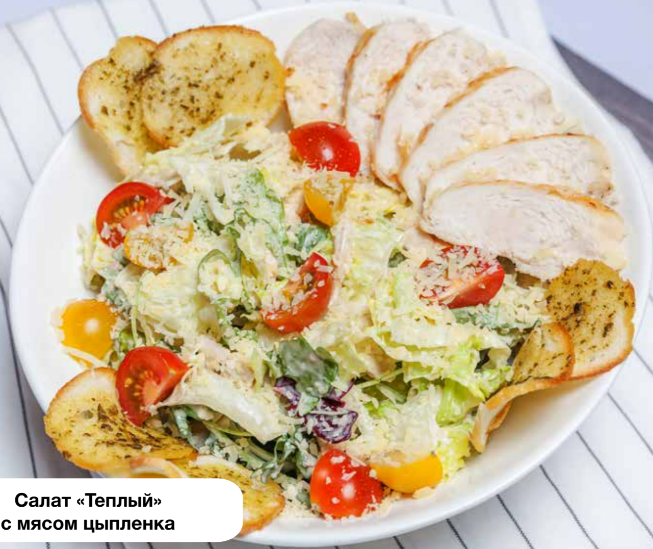
Салат «Теплый» с мясом цыпленка