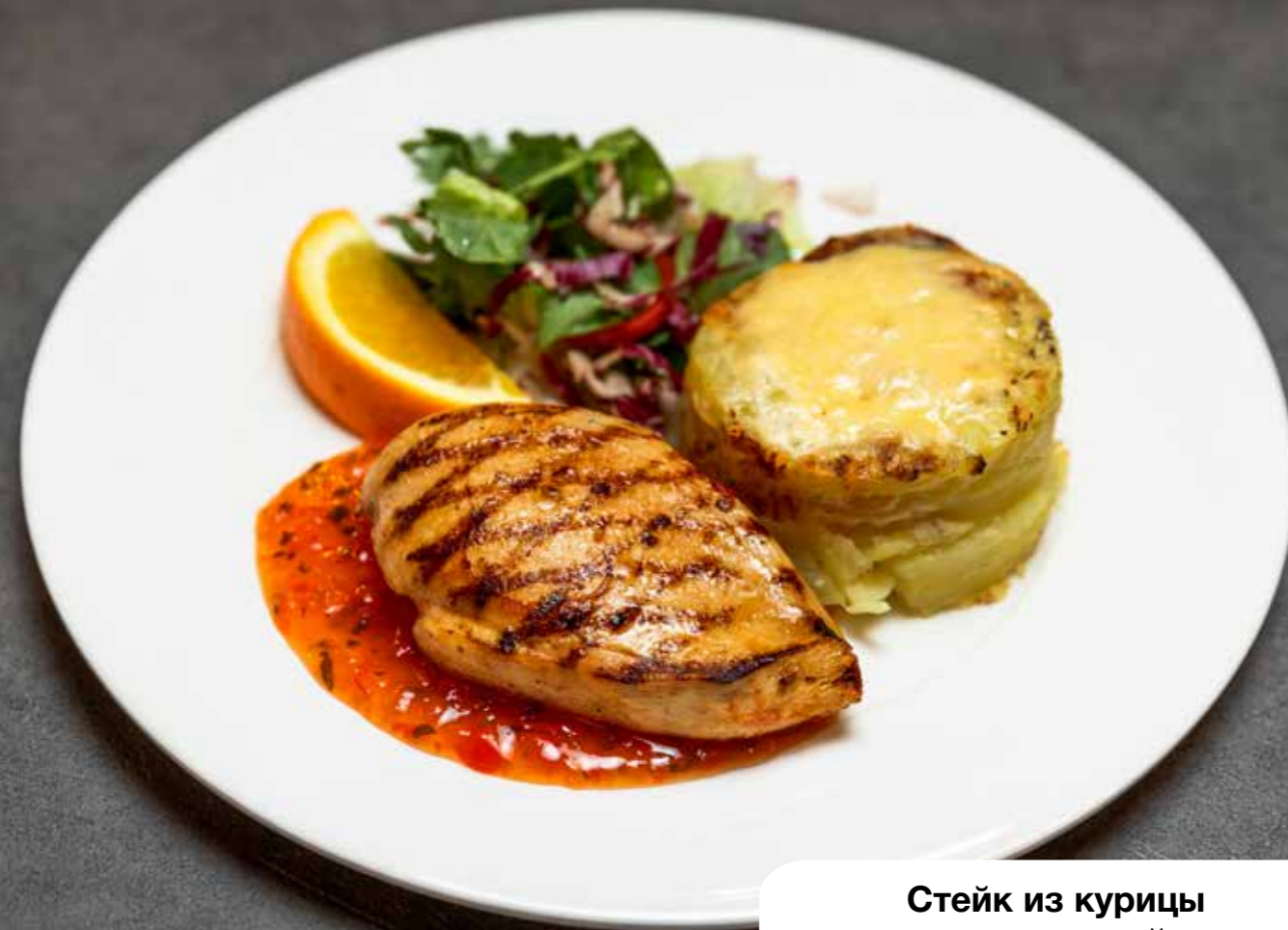
Стейк из курицы с соусом сладкий чили