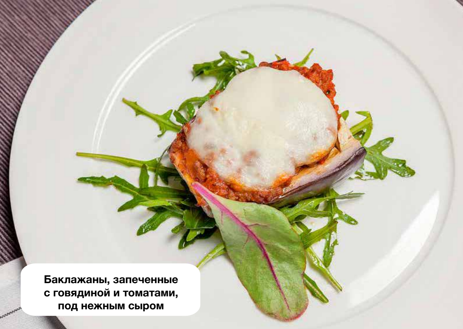
Баклажаны, запеченные с говядиной и томатами, под нежным сыром