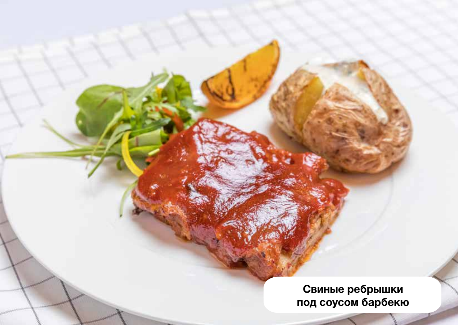
Свинные ребрышки под соусом барбекю