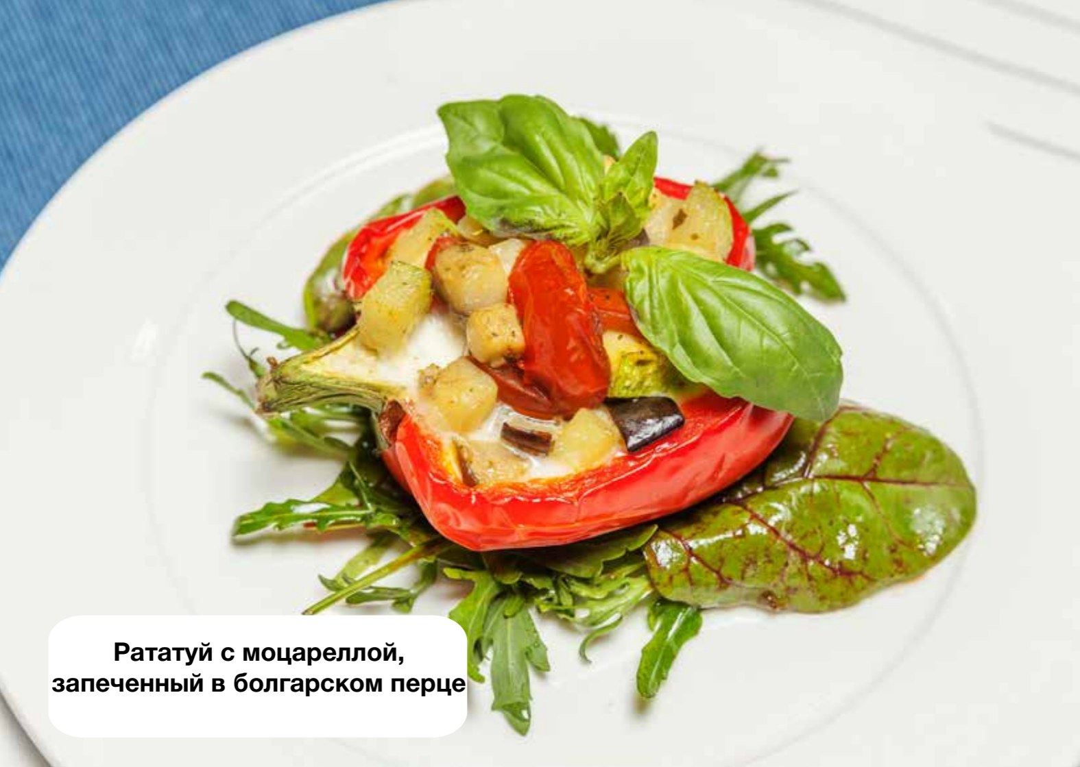
Рататуй с моцареллой, запеченный в болгарском перце