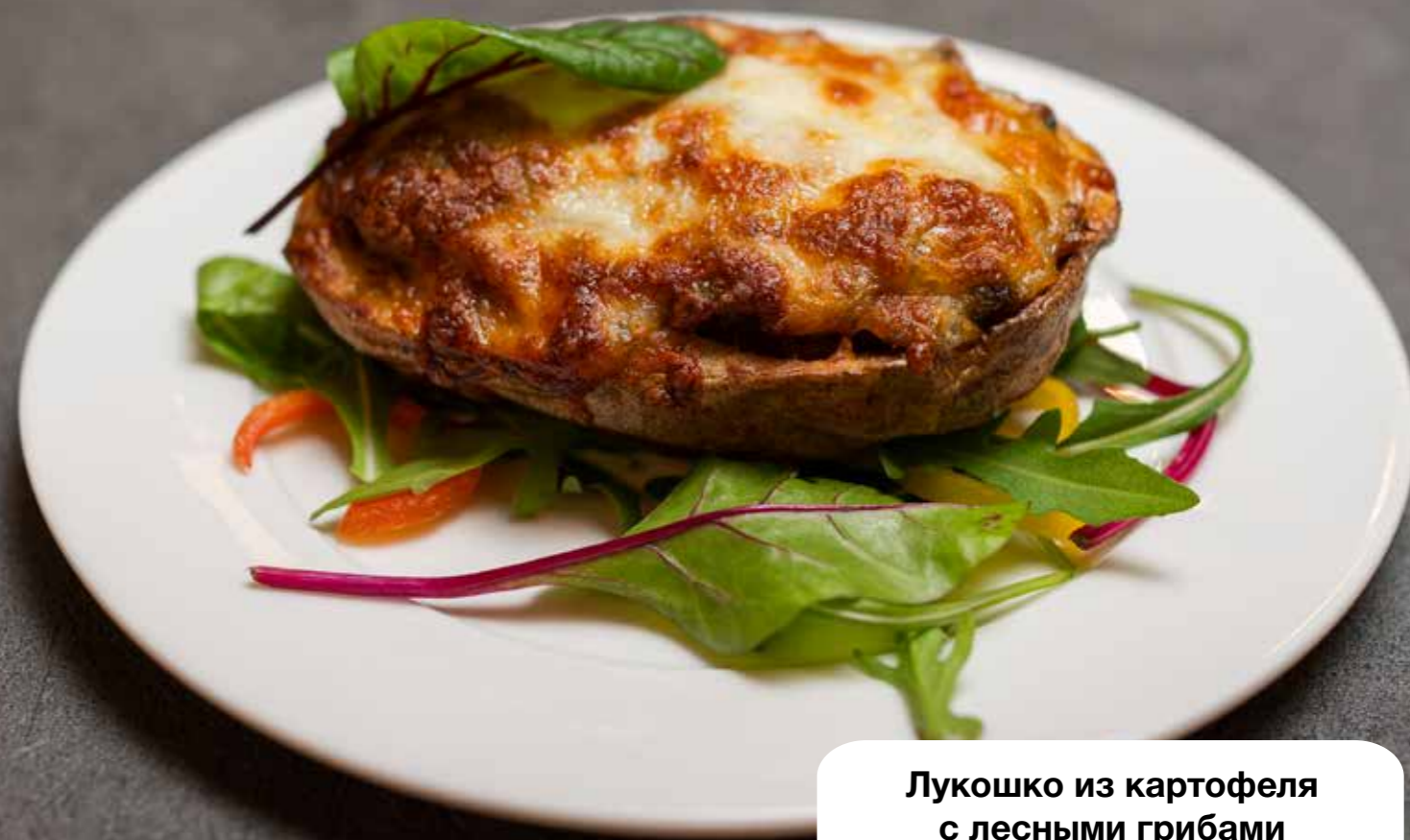
Лукошко из картофеля с лесными грибами под нежным сыром