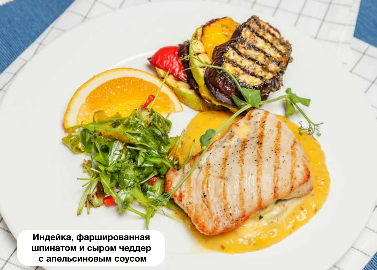
Индейка, фаршированная шпинатом и сыром чеддер с апельсиновым соусом