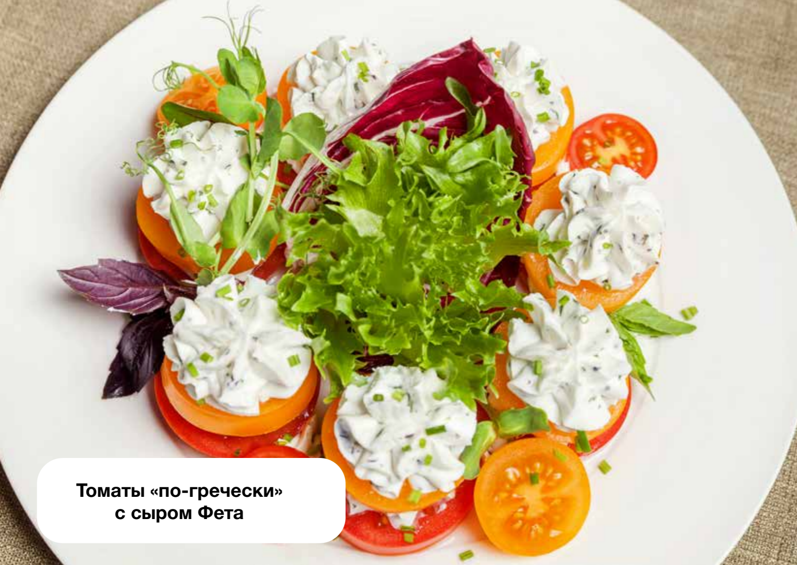
Томаты «по-гречески» с сыром Фета