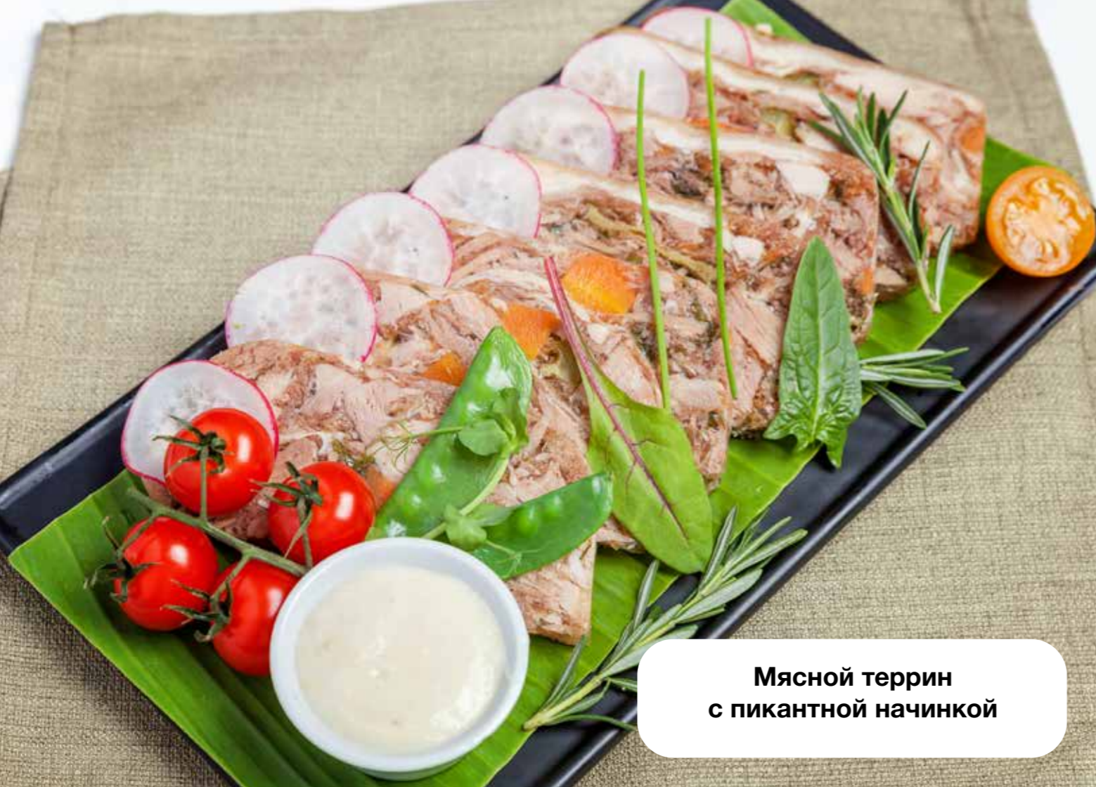
Мясной террин с пикантной начинкой