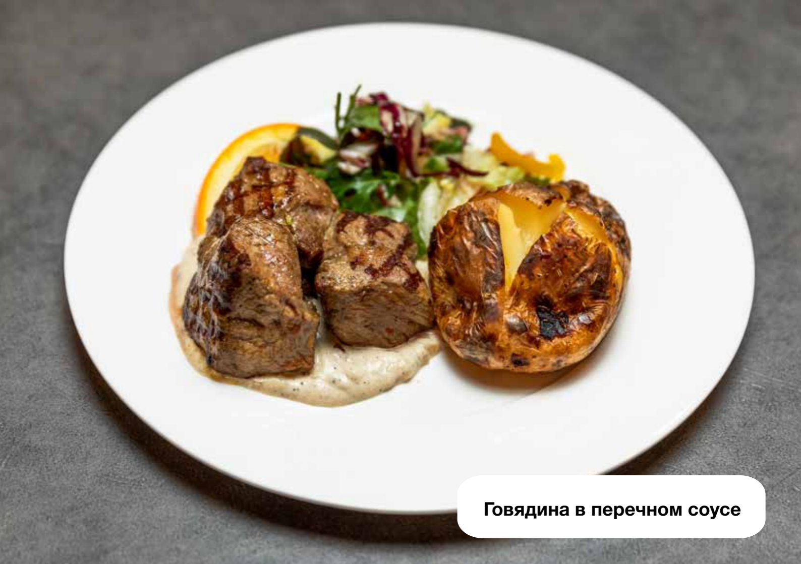
Говядина в перечном соусе