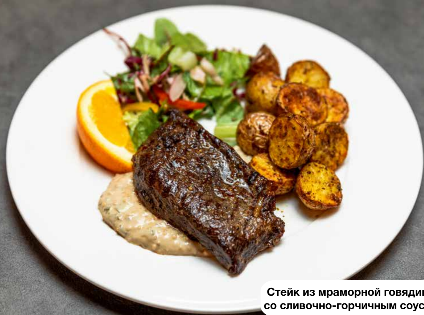
Стейк из мраморной говядины со сливочно-горчичным соусом