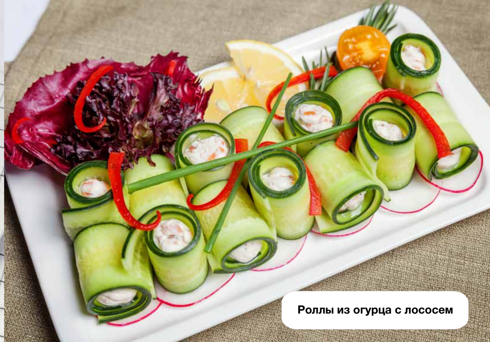
Роллы из огурца с лососем