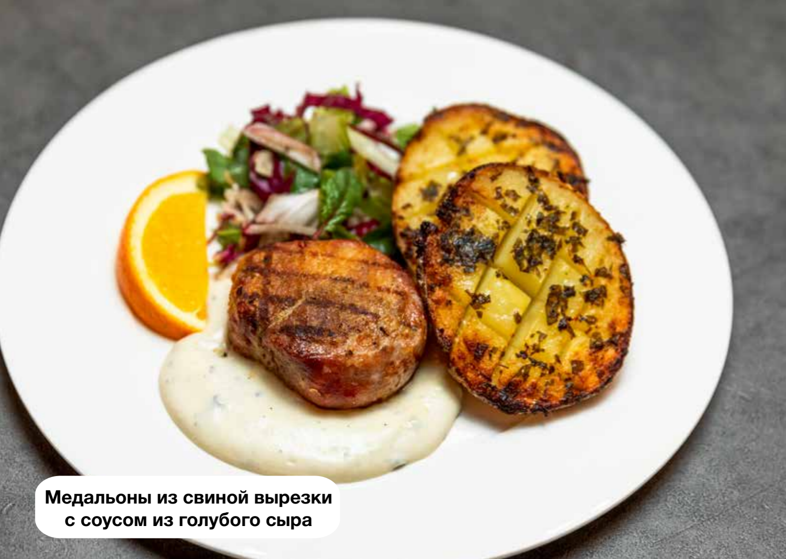
Медальоны из свиной вырезки с соусом из голубого сыра