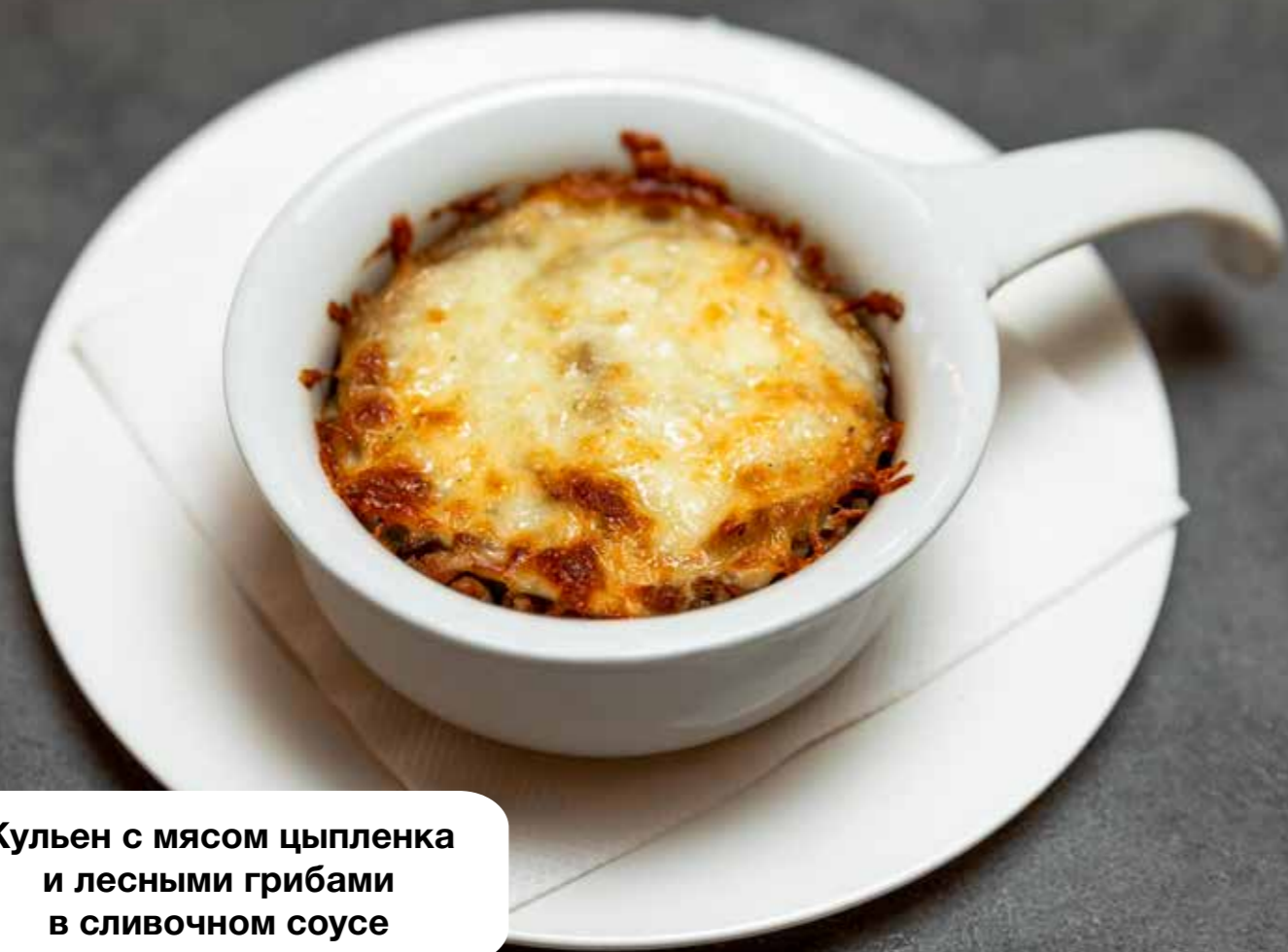
Жульен с мясом цыпленка и лесными грибами в сливочном соусе