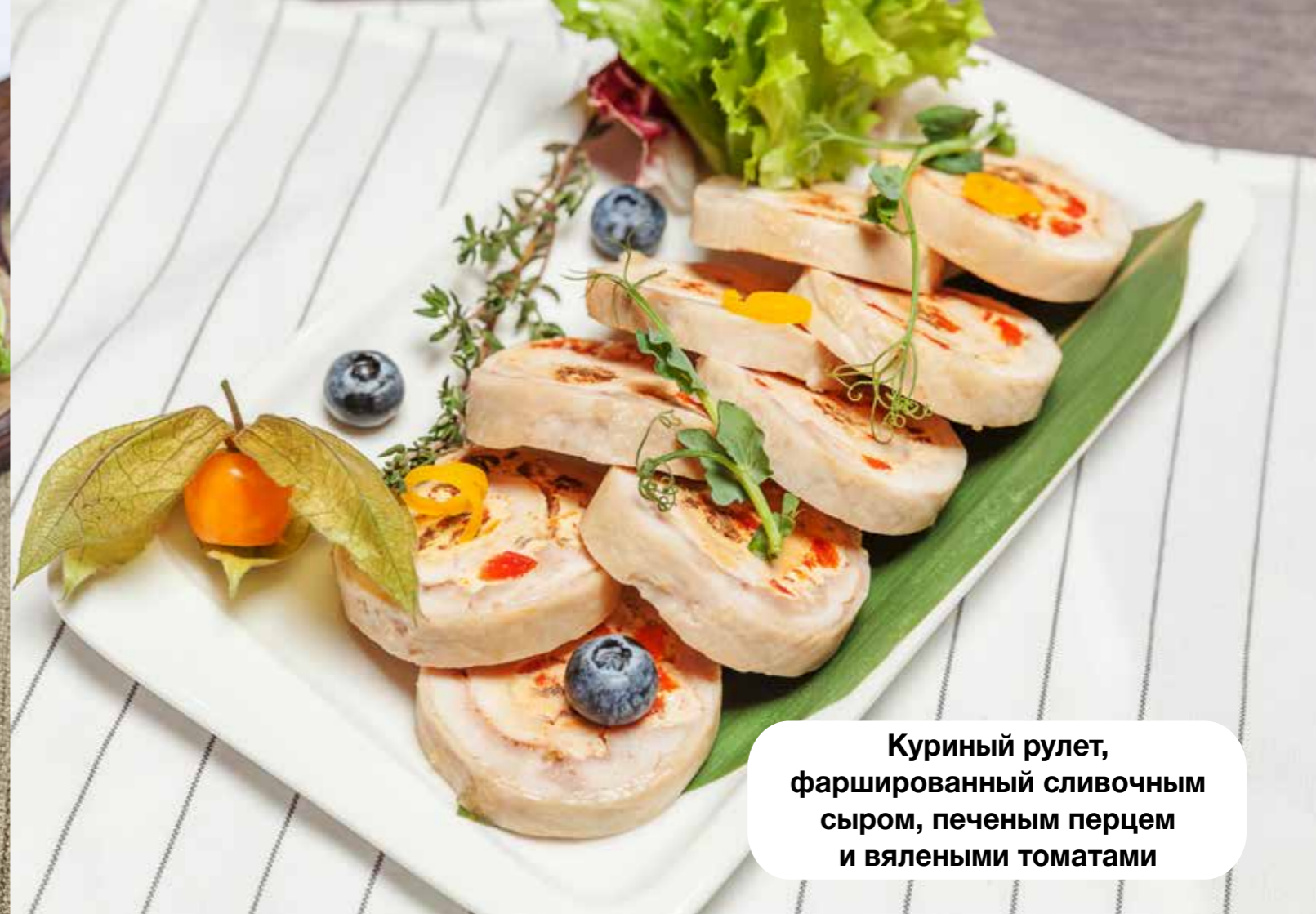
Куриный рулет, фаршированный сливочным сыром, печеным перцем и вялеными томатами