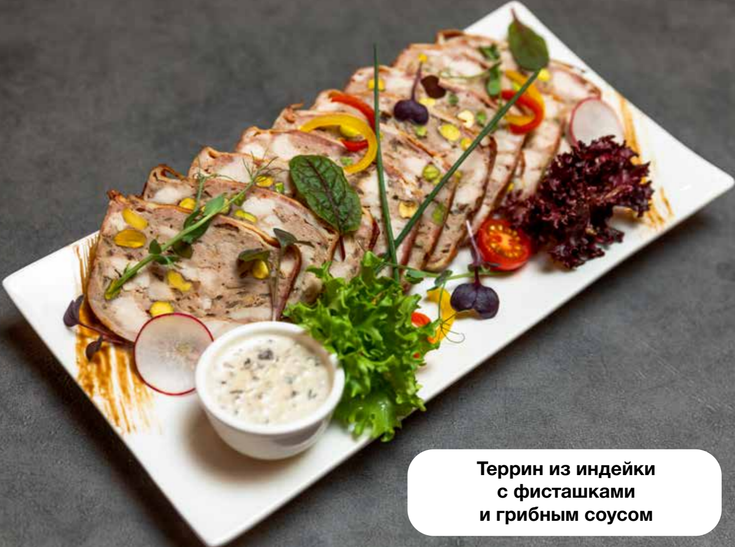
Террин из индейки с фисташками и грибным соусом