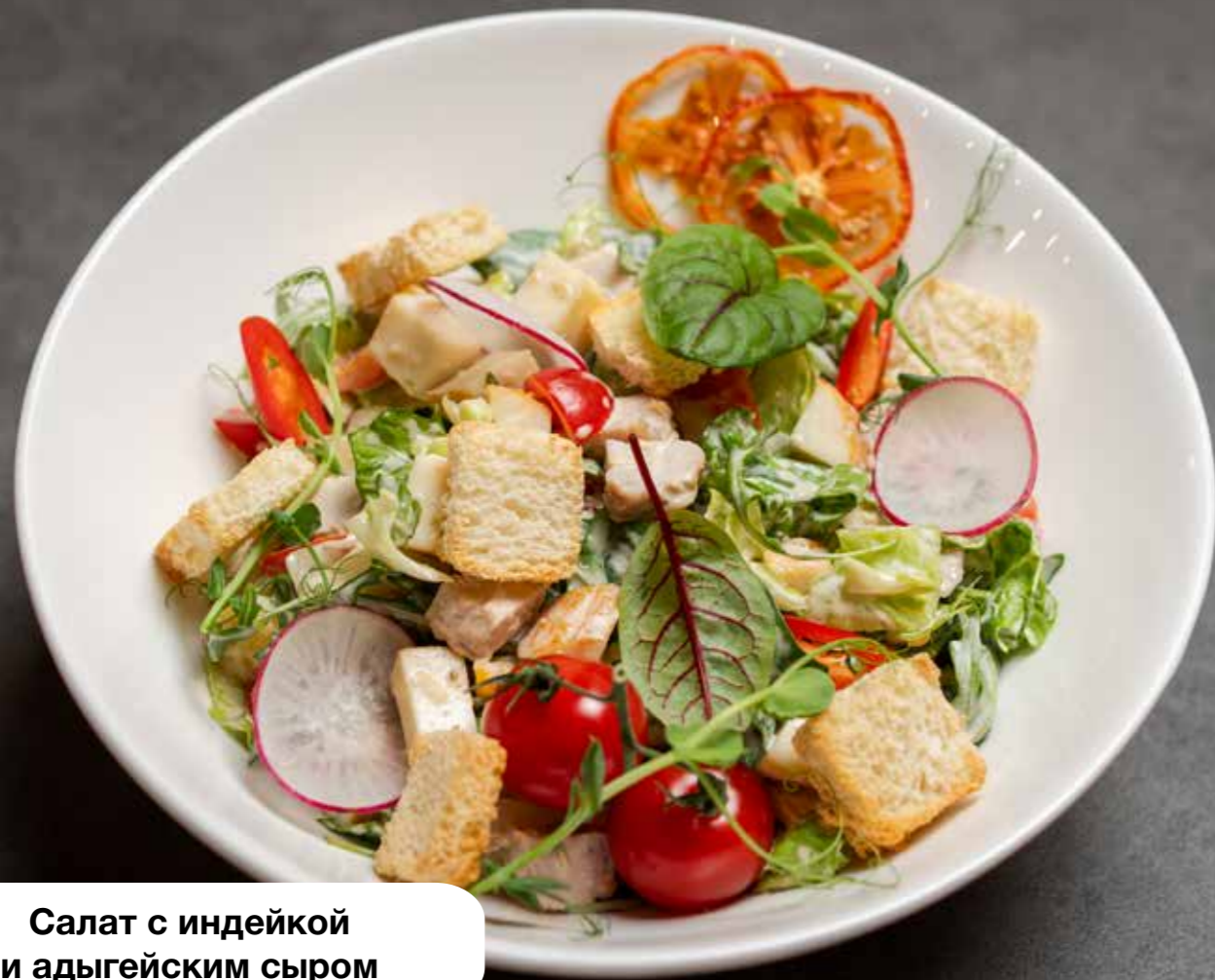
Салат с индейкой и адыгейским сыром