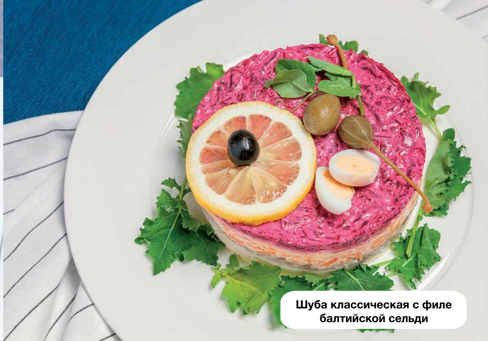
Шуба классическая с филе балтийской сельди