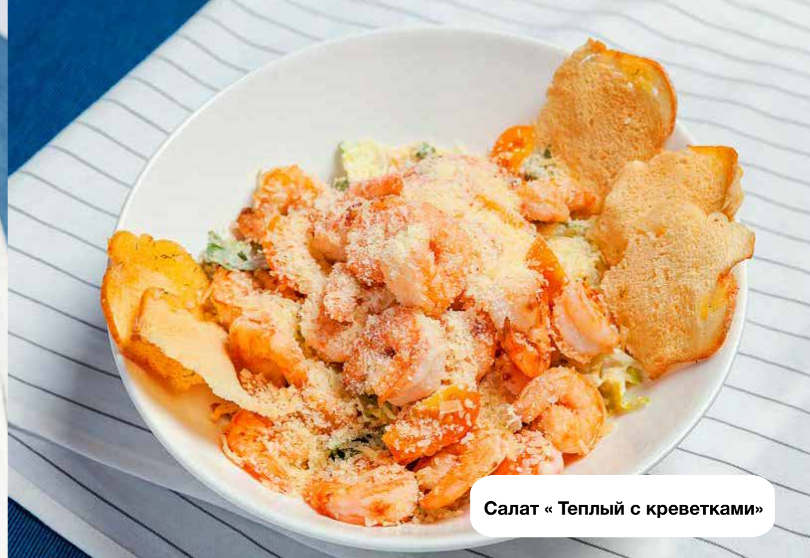
Салат «Теплый с креветками»