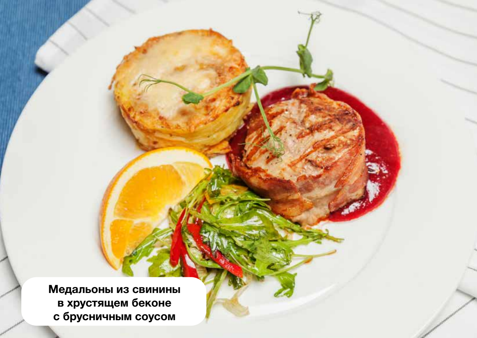
Медальоны из свинины в хрустящем беконе с брусничным соусом