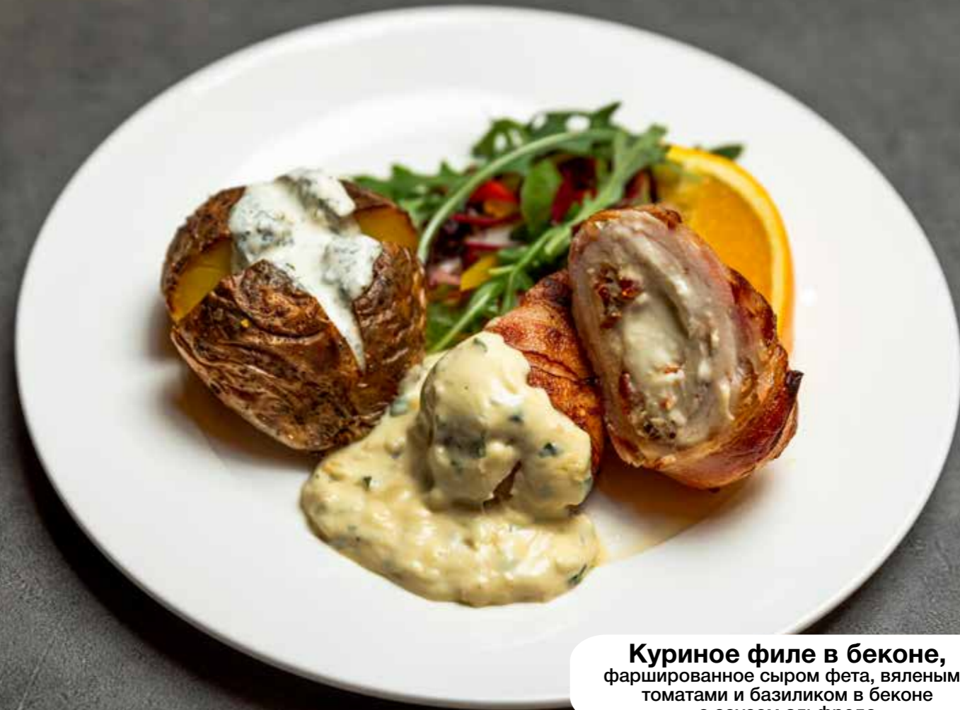
Куриное филе в беконе, фаршированное сыром фета, вялеными томатами и базиликом в беконе с соусом альфредо