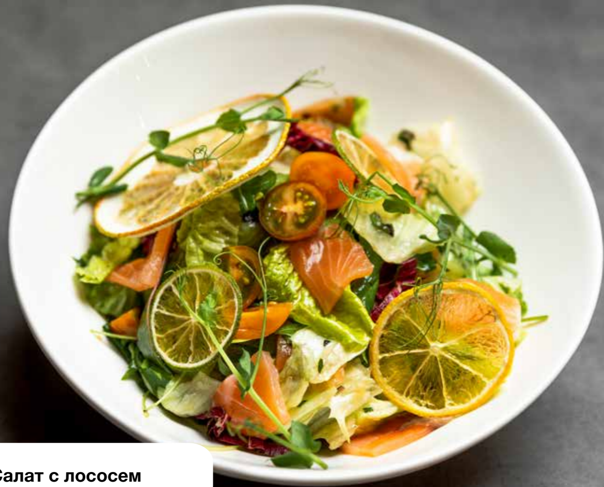
Салат с лососем