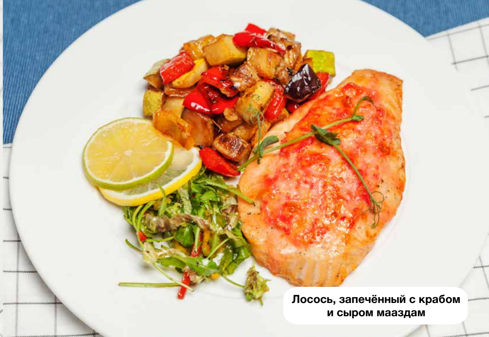
Лосось, запечённый с крабом и сыром мааздам