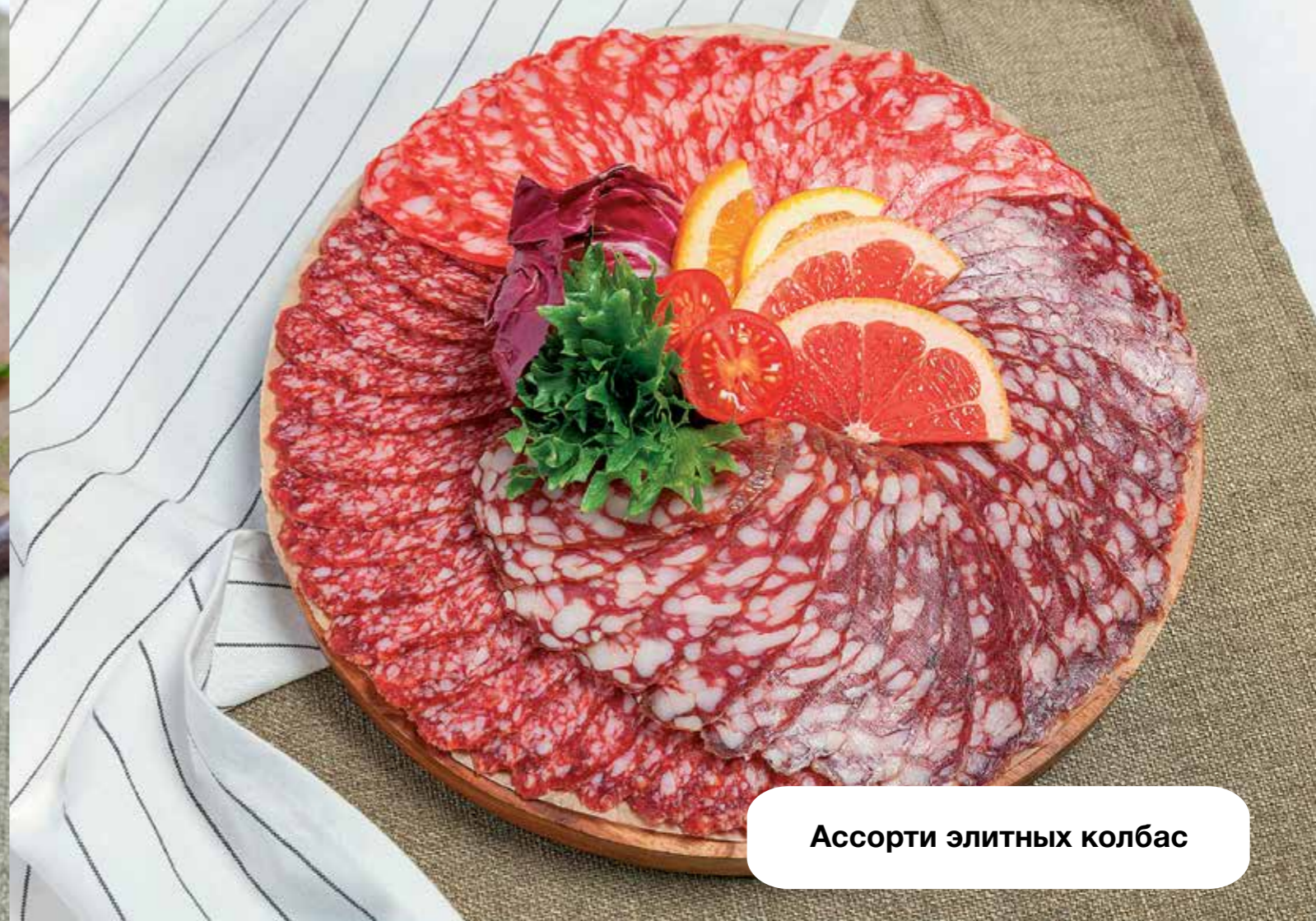
Ассорти элитных колбас