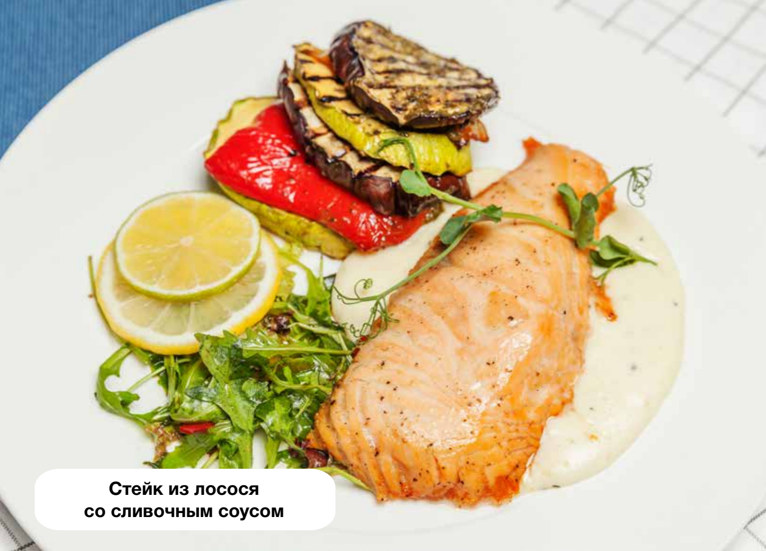
Стейк из лосося со сливочным соусом