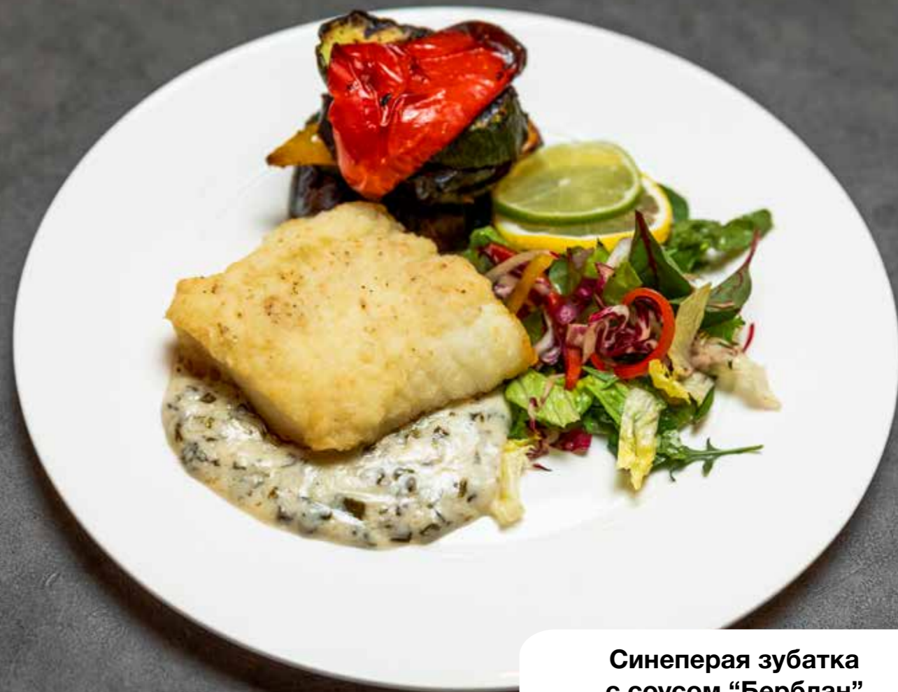
Синеперая зубатка с соусом “Берблан”