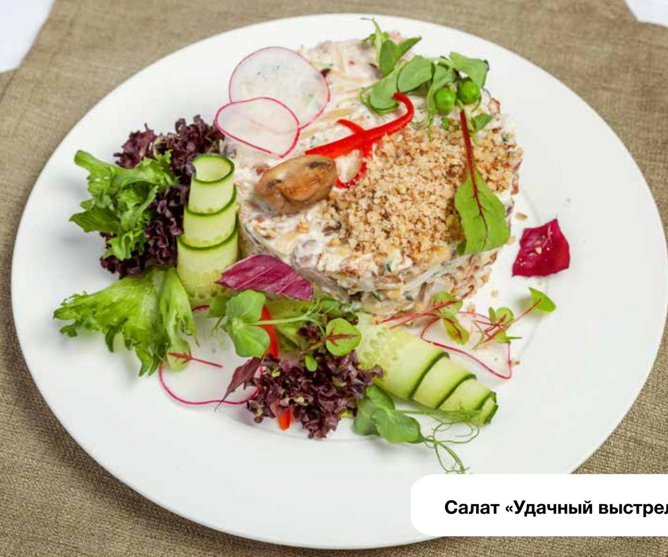
Салат «Удачный выстрел»