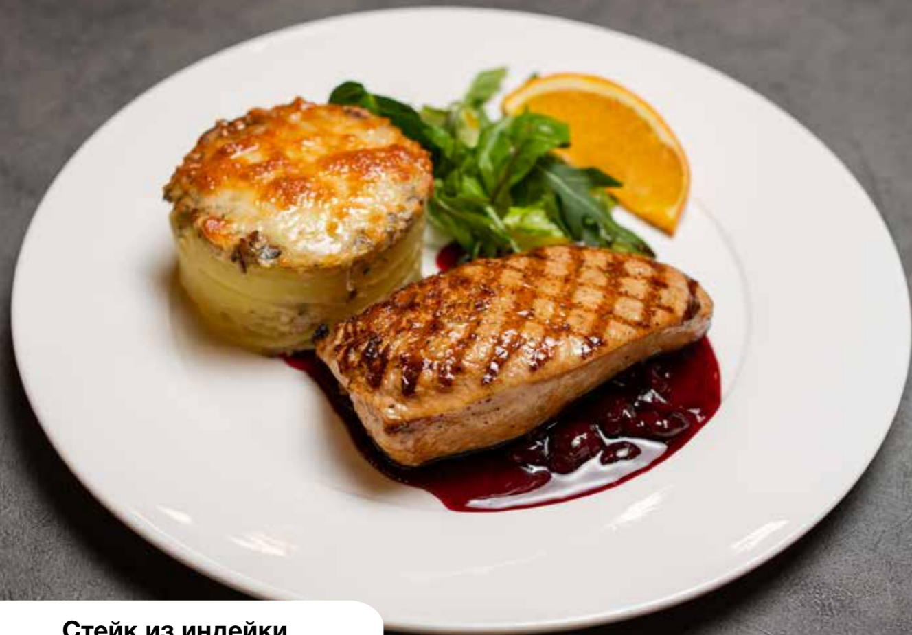
Стейк из индейки с соусом пьяная вишня