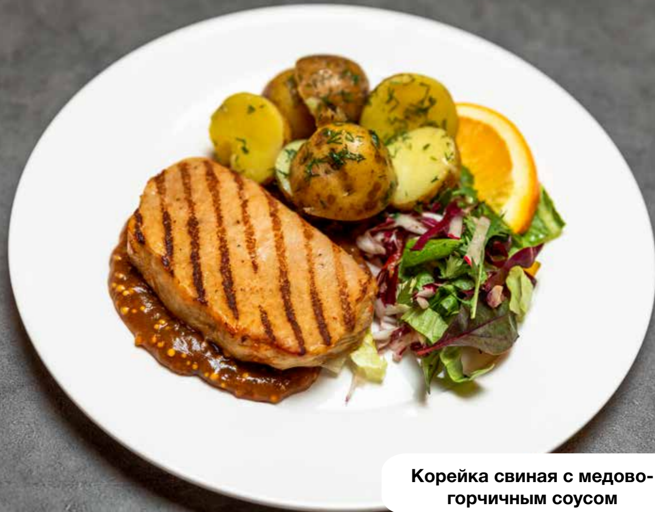
Корейка свиная с медово-горчичным соусом