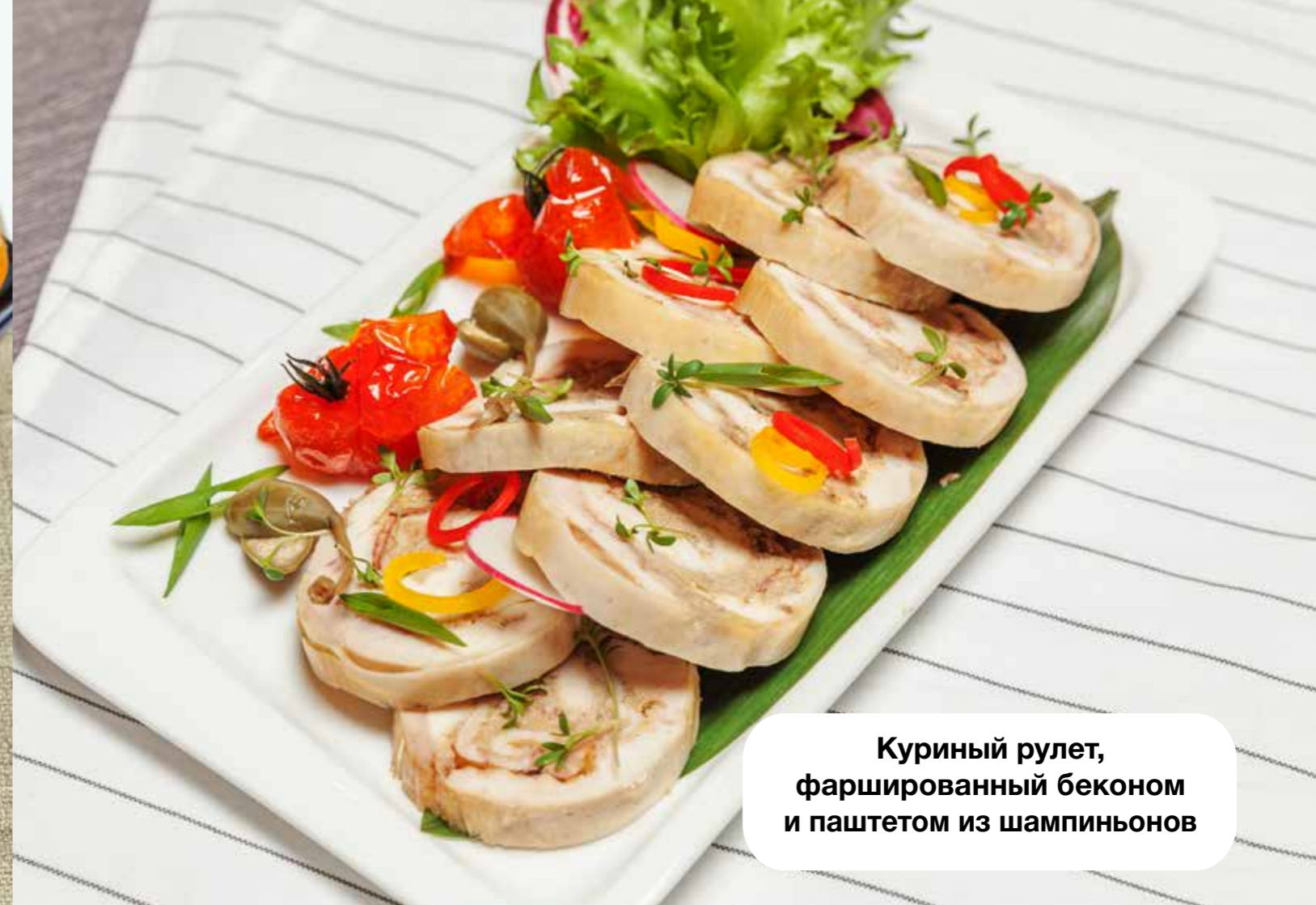
Куриный рулет, фаршированный беконом и паштетом из шампиньонов