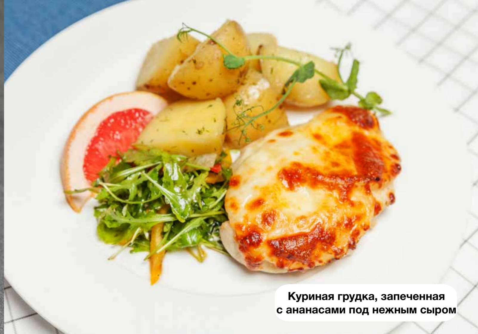
Куриная грудка, запеченная с ананасами под нежным сыром