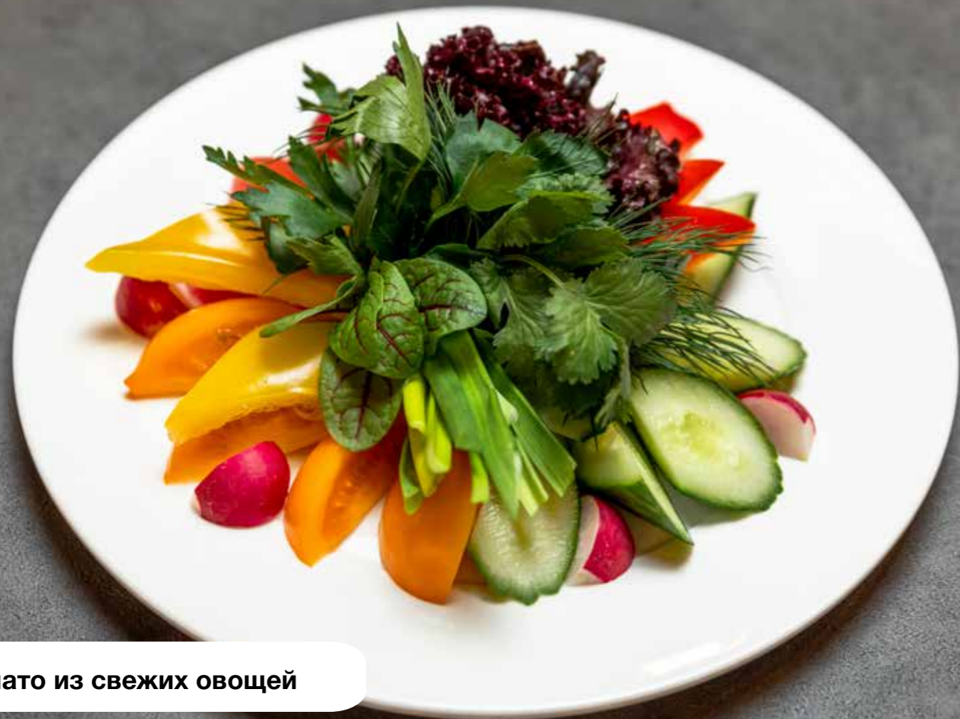
Плато из свежих овощей