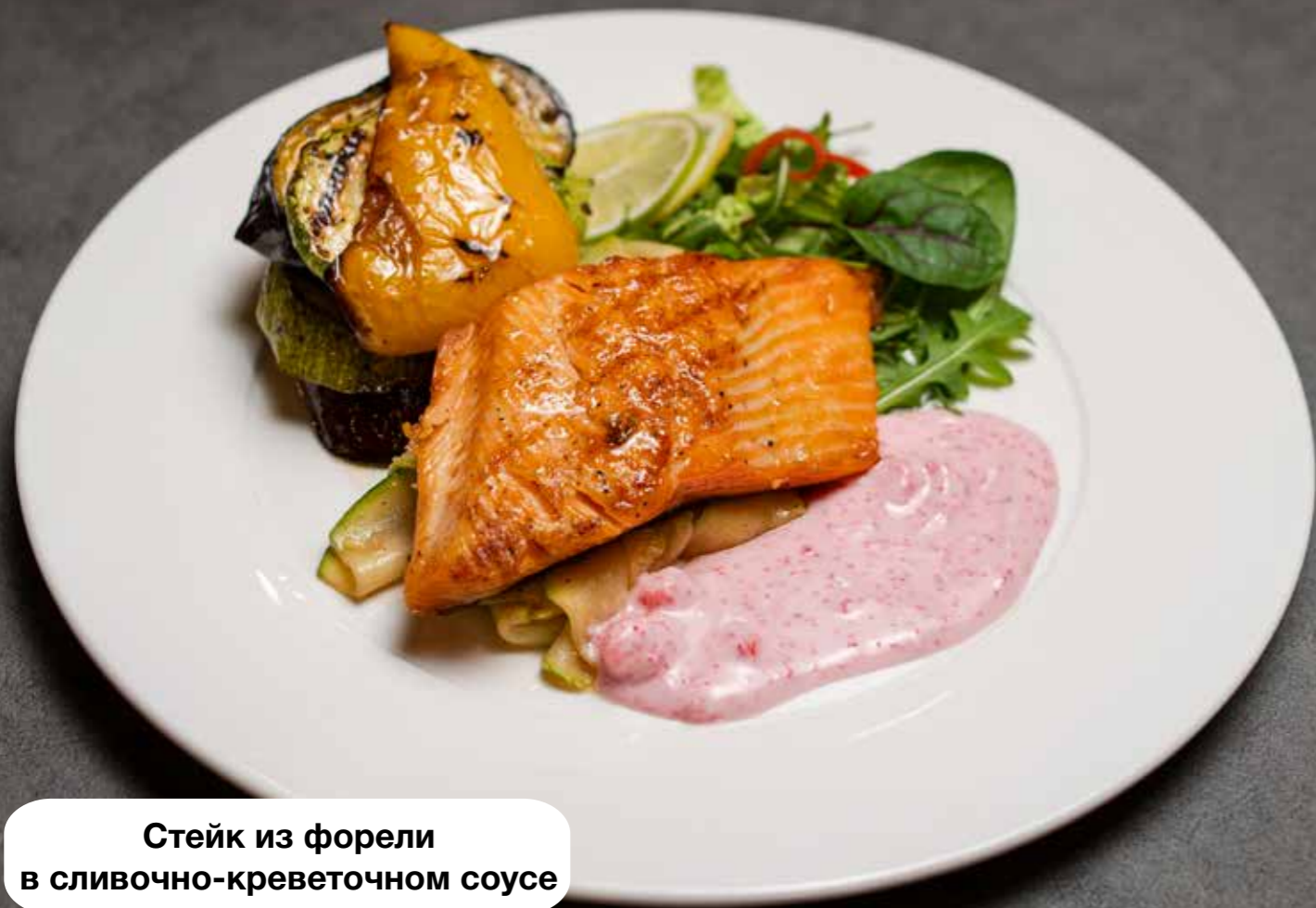
Стейк из форели в сливочно-креветочном соусе