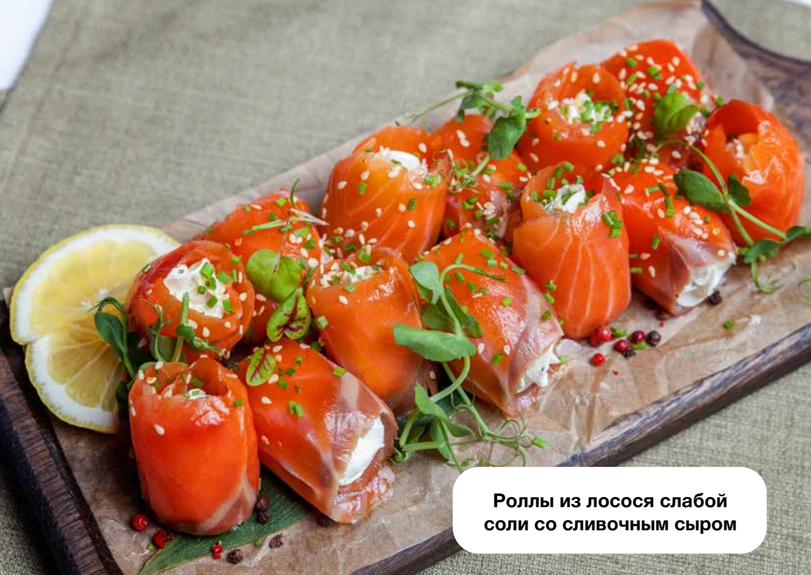
Роллы из лосося слабой соли со сливочным сыром