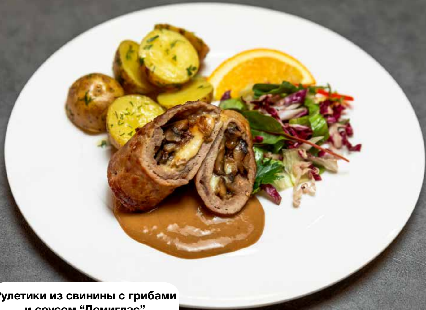
Рулетики из свинины с грибами и соусом “Демиглас”