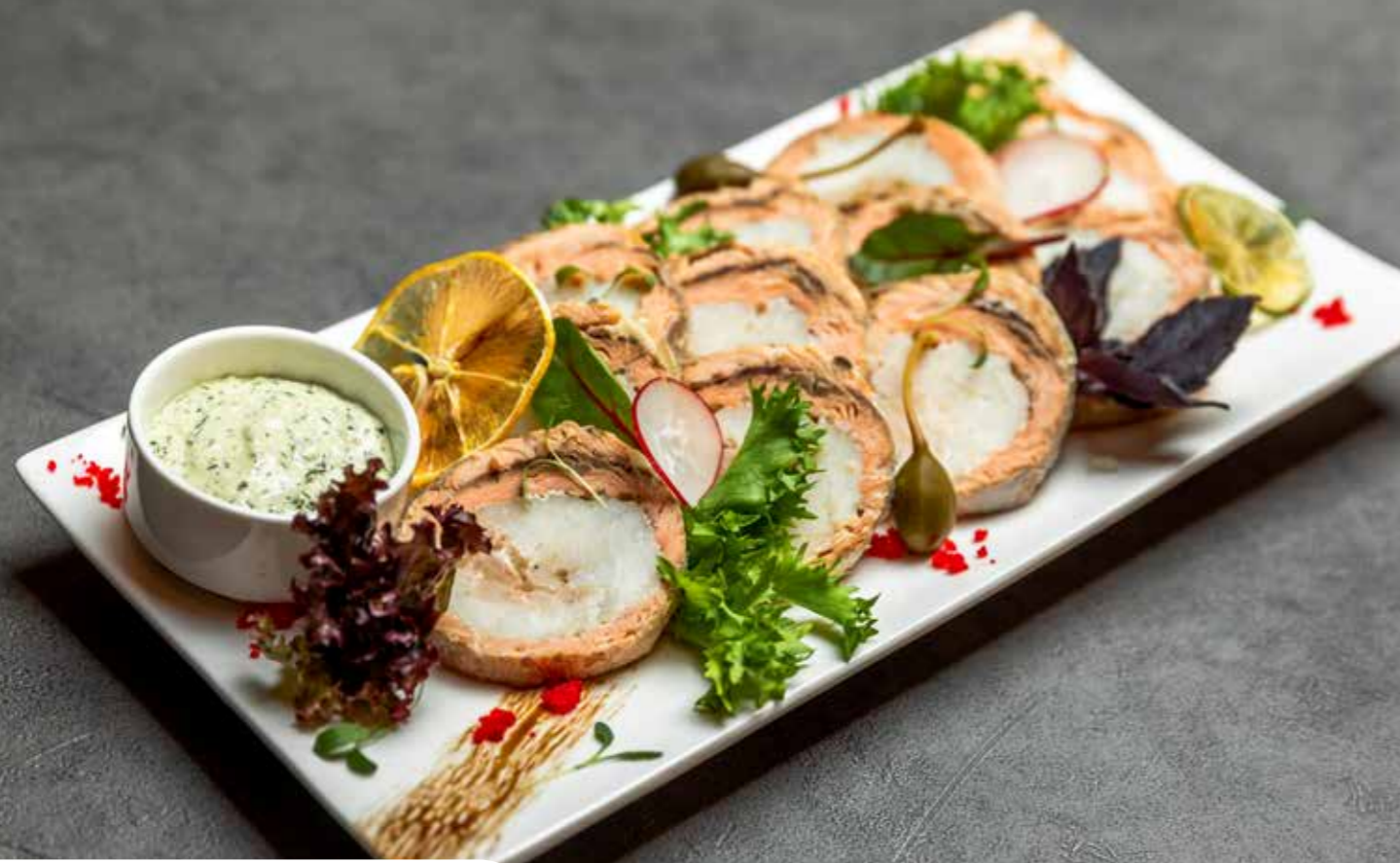
Горбуша, фаршированная судаком и креветками