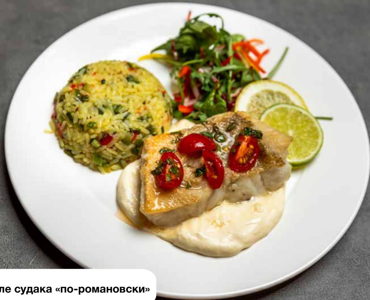
Филе судака «по-романовски»