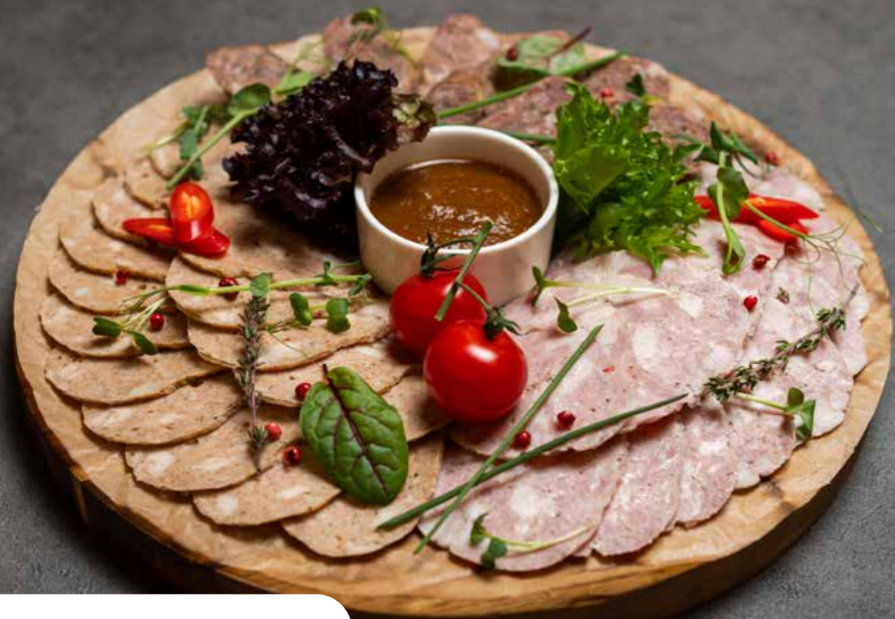
Мясная нарезка из домашних колбас